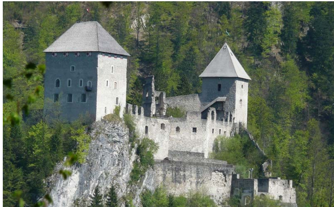
Burg Gallenstein ( Österreich )